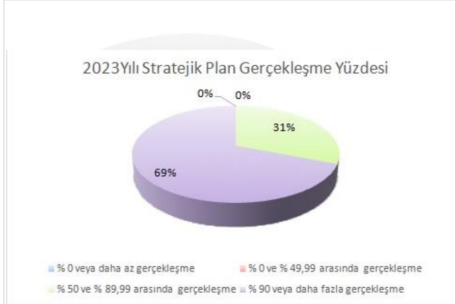
Şekil 1 Mevcut Stratejik Plan Değerlendirme Grafiği

Mehmet Varinli İlkokulu 2019-2023 Stratejik Planı'nın gerçekleşme durumu değerlendirildiğinde; Hedef 1.1 %60 ile kısmi-makul düzeyde hedefe ulaşma seviyesindedir. Hedef 2.1 %75 ile kısmi-makul düzeyde hedefe ulaşma seviyesindedir. Hedef 3.1.1. %70 ile kısmi-makul düzeyde gerçekleşmiştir. Hedef 4.1.1. %80,00 ile hedefin gerçekleşme durumu kısmi-makul düzeyde olmuştur. Hedef 5.1.1 %71.42 ile hedef gerçekleşme düzeyi kısmi-makul düzeydedir. Hedef 6.1.1 %80 ile kısmi-makul düzeydedir. Sonuç olarak 6 hedefin 6 sına da kısmi-makul düzeyde ulaşılmıştır. Gerileme veya hedeften sapma durumunda olan stratejik hedef bulunmamaktadır. Bu değerlendirme sonucunda ise hedeflere ulaşma noktasında etki eden önemli gelişmeler yaşandığını gözlemledik. Bu gelişmeler, planlarımızın bazı alanlarda başarısızlığa neden olmasına yol açtı.